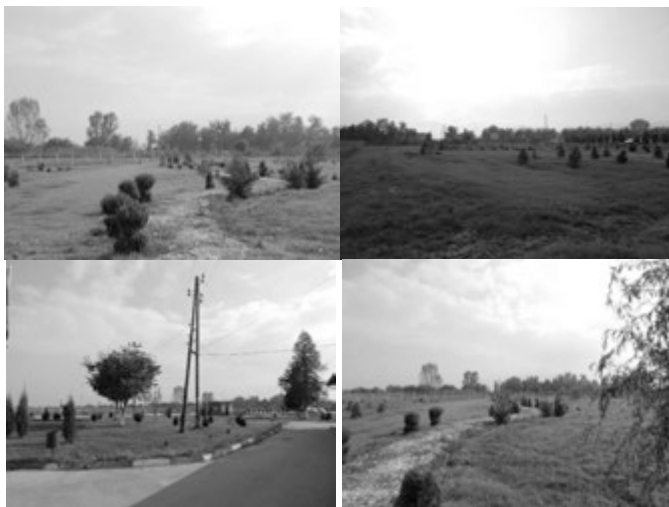
Слика. Ботаничка градина (арборетум) во Наставен центар Струмица (сеп. 2018)